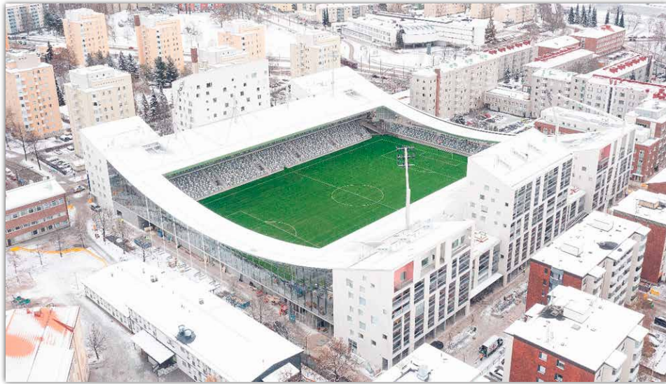
TAMMELAN STADION - JKMM

Teräsrakenneyhdistys Finnish Constructional Steelwork Association