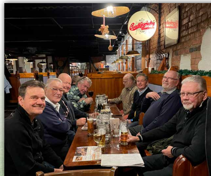
Vuosikokoustunnelmia Panimoravintola Plevnasta